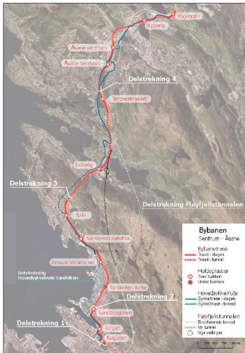
Figur 2 Oversiktskart