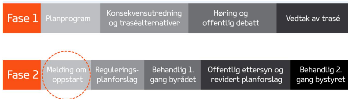
Figur 1 Planprosessen

Denne byrådssaken gjelder oppstart av reguleringsplaner for Bybanen og hovedsykkelrute fra sentrum til Åsane. Figuren under visualiserer hvor langt planarbeidet er kommet.